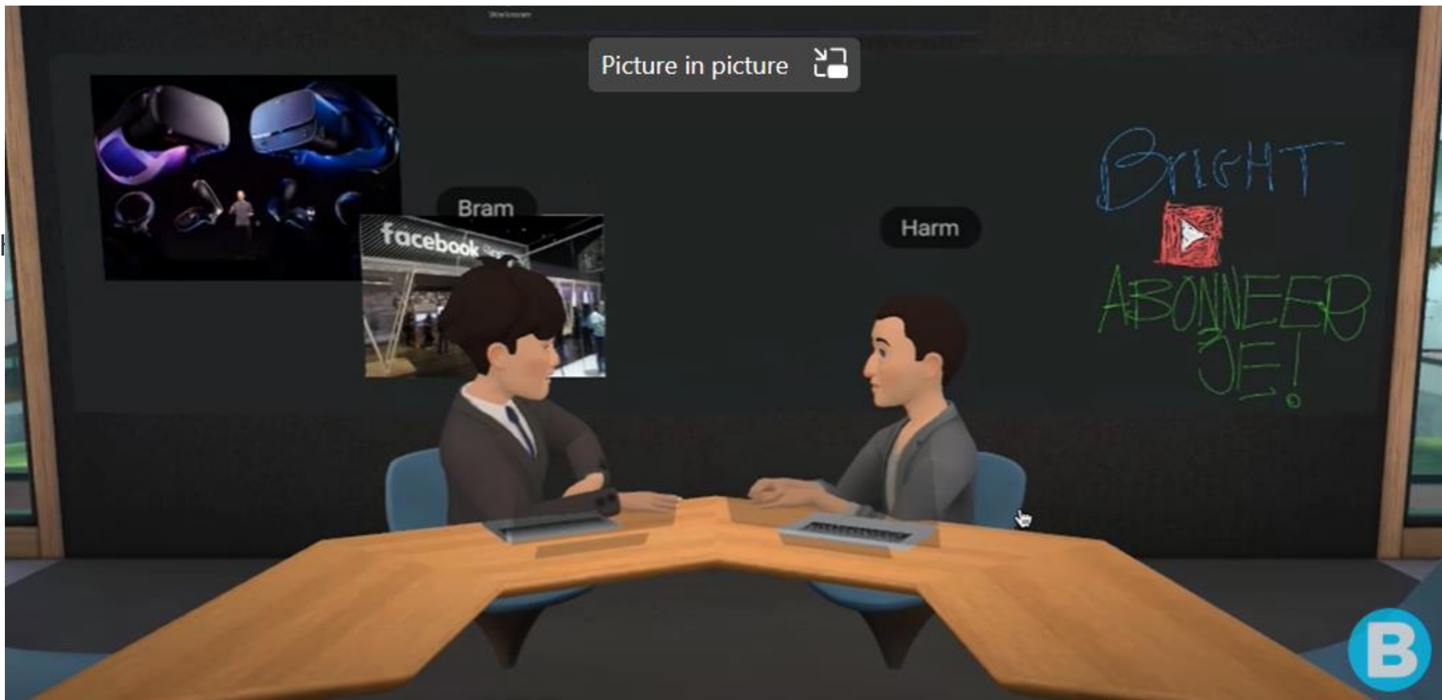
Metaverse komt eraan: samenwerken in VR? - YouTube